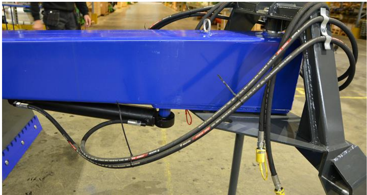
10.Då var Schaktbladet färdigmonterat!